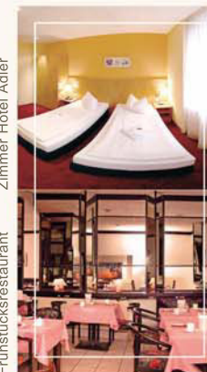
Zimmer Hotel Adler Frühstücksrestaurant