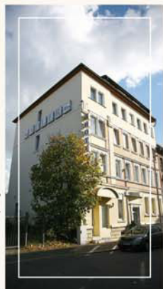
Hotel Adler Leipzig

Der Hauptbahnhof ist nur 5 Minuten entfernt und bietet Ihnen ausgezeichnete Einkaufsmöglichkeiten. Die Messe Leipzig ist in 10 Minuten und der Flughafen Leipzig in 20 Minuten zu erreichen. Diese erreichen Sie bequem mit öffentlichen Verkehrsmitteln, die direkt vor unserem Hotel halten. (S-Bahnhof Sellershausen)