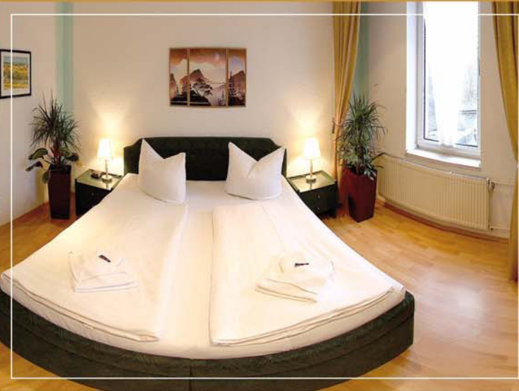
Doppelzimmer Hotel Adler Leipzig