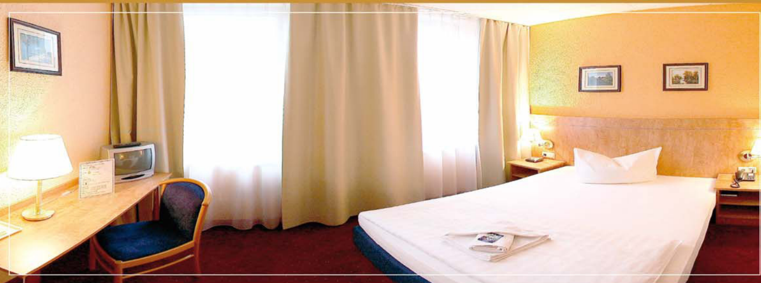
Einzelzimmer Hotel Adler Leipzig